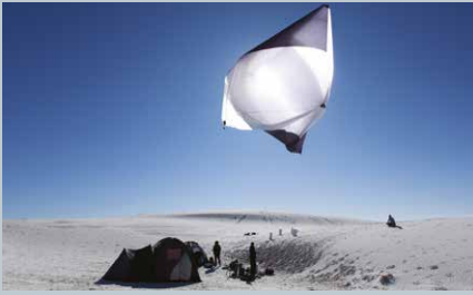
Tomás Saraceno, Aerocene, launches at White Sands Natural Park, 2015.