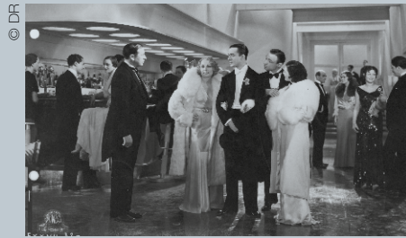
Image du film Due cuore felici .