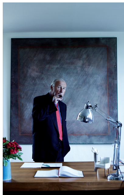
Sir Terence Conran.