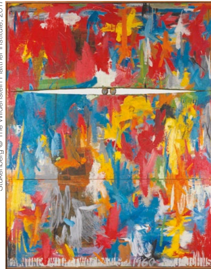
© Jasper Johns / VAGA, New York / DACS, London 2017.