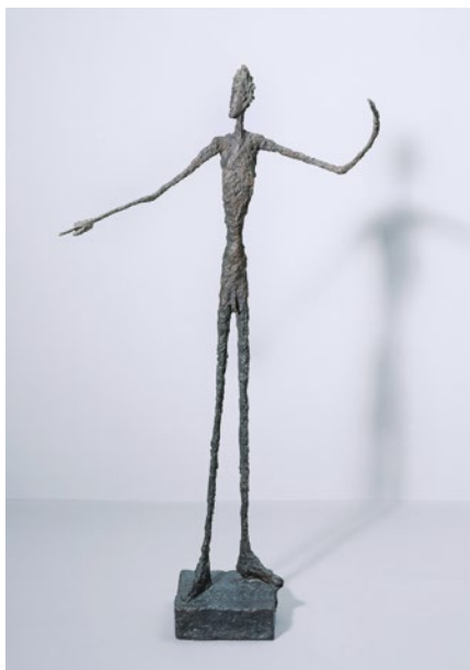
© Alberto Giacometti Estate, ACS/DACS, 2017

Alberto Giacometti, Man Pointing , 1947, bronze. Tate, Purchased 1949.