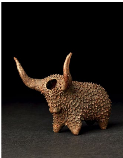
Tabatiwe Xhosa en forme de bœuf, Afrique du Sud, fin du XIX e siècle.

De l'aube de l'homme à la violence de l'apartheid, South Africa. The art of a nation retrace 100 000 ans d'art et d'histoire. Le voyage commence avec les premiers exemples de la créativité humaine, l'art rupestre, aux compositions d'artistes contemporains de la période postapartheid. Les trésors en or du royaume de Mapungubwe, ce premier grand royaume qui devait sa puissance au commerce de l'or et de marchandises précieuses, brillent de tout leur éclat. On découvre aussi des pièces de la période sombre de la ségrégation qu'illustrent des témoignages tel celui de Lionel Davis, incarcéré comme prisonnier politique à Robben Island où il rencontra Nelson Mandela. Une période violente qui a vu s'ériger des personnalités fortes et charismatiques contre les inégalités, comme Helen Suzman, seule députée blanche qui lutta à l'époque contre l'apartheid et les violations des droits de l'homme. On contempera également les créations colorées des Ndebele et d'artistes contemporains de renommée internationale qui recueillirent l'admiration de nombreux collectionneurs et marchands d'art.