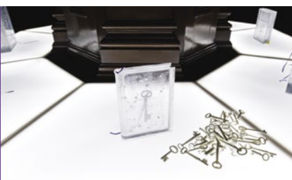
Aiko Miyanaga, détail de l'installation Strata: slumbering on the shore , 2014, à la Bibliothèque centrale de Liverpool.