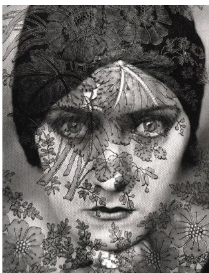
Edward Steichen, L'actrice Gloria Swanson, photographiée pour Vanity Fair , 1 er février 1924.

PAS MOINS DE 200 VINTAGES, RÉUNIS SPÉCIALEMENT POUR l'événement, illustrent la période durant laquelle Edward Steichen travailla comme photographe en chef des publications du groupe américain Condé Nast Publisher, fondé par Condé Montrose Nast. Séduit par ses photographies pictorialistes, Condé Nast lui confie en 1923 la direction artistique des prestigieux magazines Vogue et Vanity Fair pour lesquels il réalise notamment de nombreux portraits de célébrités mises en valeur avec art et élégance. Steichen, considéré comme le père de la photographie de mode moderne, est l'un des photographes les plus influents de l'histoire de la photographie au xx e siècle. L'une de ses photographies de l'actrice Greta Garbo, datant de 1928 et parue en couverture du magazine Life , demeure l'un des plus inoubliables portraits de l'actrice.