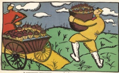
Kazimir Malévitch, Nos Alliés français ont un panier rempli d'Allemands capturés, et nos frères britanniques en ont un barril plein , 1914, lithographie.