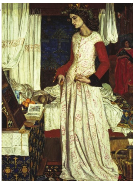
William Morris, La Belle Iseult , 1858, huile sur toile.