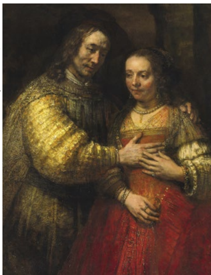
Rembrandt, Isaac et Rebecca, dit "La Fiancée juive" (détail), vers 1665, huile sur toile.

LOIN DE S'EFFACER AVEC LE TEMPS, LE TALENT DE REMBRANDT conserva sa grande force créatrice, et ce malgré les nombreux avatars qu'il connut. Profondément émouvantes, réalistes et modernes, ses œuvres de jeunesse et de maturité douloureuse fixèrent dans l'histoire de l'art pictural la notoriété de l'homme et de l'artiste. Cette exposition qui rassemble des tableaux provenant du monde entier plonge dans l'atmosphère pleine de passion et d'émotion du grand maître de l'âge d'or hollandais. Parmi les œuvres les plus emblématiques figurent notamment La Fiancée juive (Rijksmuseum, Amsterdam), composition d'où émane la tendresse mutuelle qui unit le couple, Vieille Femme lisant (collection du duc de Buccleuch, Écosse), Junon (Hammer Museum, Los Angeles) ou encore Lucrece (National Gallery of Art, Washington). Durant sa vie, Rembrandt n'eut de cesse de rechercher un style plus expressif et plus intense encore. Encore aujourd'hui, il est considéré comme le plus grand aquafortiste de tous les temps.