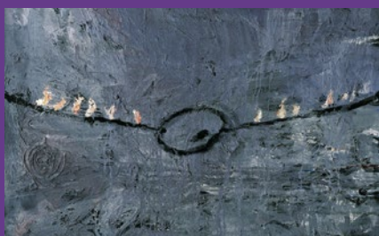
Anselm Kiefer, Palette sur une corde , 1977.