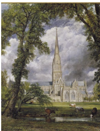
John Constable, La cathédrale de Salisbury vue du jardin de l'évêché (détail) , 1823, huile sur toile.

DANS SES PAYSAGES D'UNE AMÉNITÉ PARTICULIÈRE, DE LA FERTILE vallée de la Stour et de Borrow, John Constable s'inspire de la tradition des maîtres hollandais, par l'intermédiaire des œuvres de Thomas Gainsborough ou de Richard Wilson. Cependant, l'étude de la nature développera son talent. Aussi, vers 1810, est-il l'un des premiers paysagistes à peindre en plein air la campagne anglaise qu'il décrit avec sensibilité: "La beauté du paysage environnant, les charmants coteaux, les prairies luxuriantes parsemées de troupeaux et de terres bien cultivées, les bois et les rivières, les nombreuses églises et villages avec leurs fermes et leurs cottages pittoresques." Ses peintures, aquarelles et dessins dont quelques-uns des plus célèbres: La Charrette de foin , Le Saut du cheval , plusieurs versions de La Cathédrale de Salisbury , La Côte de Brighton le soir , chargées de lyrisme, plongent le spectateur dans une profonde contemplation. La vaste rétrospective retrace les techniques, l'influence et l'héritage laissé par ce peintre britannique sensible et poétique, dont la vision spontanée annonça et influença les paysagistes romantiques.