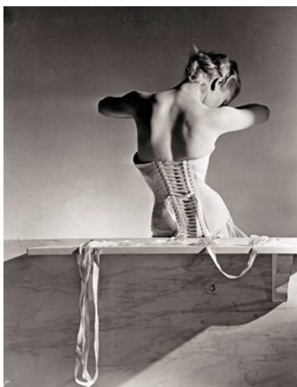
Horst P. Horst, Corset de Detolle pour Mainbocher , 1939, photographie noir et blanc.

HORST PAUL ALBERT BOHRMANN PHOTOGRAPHE LA SCÈNE parisienne dans les années 1930 et immortalise notamment des créations de Chanel, Schiaparelli et Vionnet. Plus tard, à New York, il travaillera notamment pour Vogue et participera à l'essor de la photographie en couleurs. Son style distingué, d'inspiration classique mais résolument moderne, a eu une incidence considérable sur la photographie de mode. Horst obtient la citoyenneté américaine en 1943 et change son nom en Horst P. Horst. Il est incorporé dans l'armée américaine, où il sert en tant que photographe. Réputé pour ses éclairages dramatiques, ses influences classiques et son élégance sensuelle, son travail fait de lui un artiste très recherché dans le monde des photos de mode publicitaires, jusqu'à sa mort en 1999. Nombre de ses images, comme Le Corset Mainbocher , ont atteint le statut d'icônes. L'exposition réunira ses créations les plus célèbres, ainsi que des impressions rares et inédites aux sujets divers, stars hollywoodiennes et autres pay-sages naturels et natures mortes.