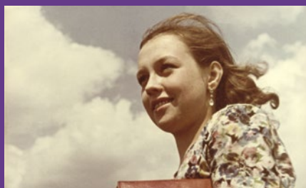
Ivan Shagin, Étudiante , début des années 1950, photographie colorisée.

PONTE DE L'ARCHITECTURE DES 1955 JUSQU'À SA MORT EN 1974, Louis Isadore Kahn s'intéressait aux nouvelles possibilités structurelles offertes par les matériaux produits industriellement et dessina de nombreux plans avec l'exigence d'un éclairage obtenu par la lumière naturelle. Il était revenu aux archétypes, aux formes essentielles, à l'espace premier, irréfutable, et fit de son architecture un style atemporel. Redonnant une valeur aux épaisseurs, il réintroduisit le mur porteur dans son élément. Louis I. Kahn laissait aux matériaux leurs libres expressions, sans forcer, en toute humilité. Perfectionniste et artiste convaincu que l'architecte a une responsabilité importante, il participa aux grands débats architecturaux de son temps, axés sur la monumentalité, l'authenticité et l'idée de communauté. Son influence a marqué de nombreux architectes – un fait avéré par les entretiens avec Frank Gehry, Renzo Piano, Peter Zumthor et Sou Fujimoto qui figurent dans l'exposition.