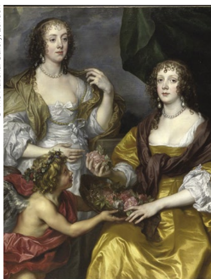
Antoine Van Dyck, Lady Elizabeth Thimbelby et Dorothy, vicomtesse d'Andover , vers 1637.

DU 18 JUIN AU 7 SEPTEMBRE – THE NATIONAL GALLERY TRAFALGAR SQUARE, LONDRES – WWW.NATIONALGALLERY.ORG.UK