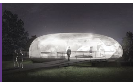
Smiljan Radic, Pavillon de la Serpentine Gallery .