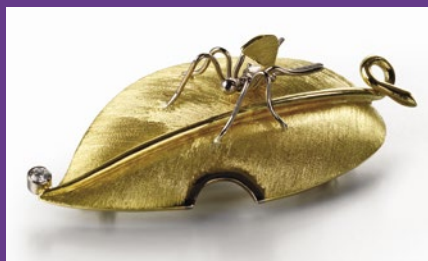
Fourmi sur une feuille , une broche en or jaune 18 carats et or blanc créée par Junko Hirai, mise en vente lors de la Goldsmiths' Fair 2013.

DU 21 SEPTEMBRE AU 16 MARS 2014 – THE MEDIA SPACE 2 e ÉTAGE DU SCIENCE MUSEUM, LONDRES – WWW.SCIENCEMUSEUM.ORG.UK