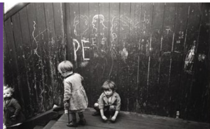
Humphrey Spender, Children's Graffiti , avril 1938, photographie.