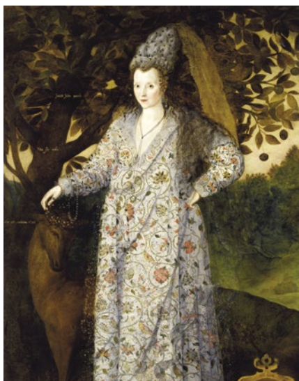
Marcus Gheeradts le Jeune, Portrait d'une inconnue , vers 1590-1600.

© HER MAJESTY QUEEN ELIZABETH II 2013 ROYAL COLLECTION TRUST