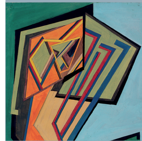
Helen Saunders, CANON . © DR

The National Gallery www.nationalgallery.org.uk du 27 juillet au 30 octobre