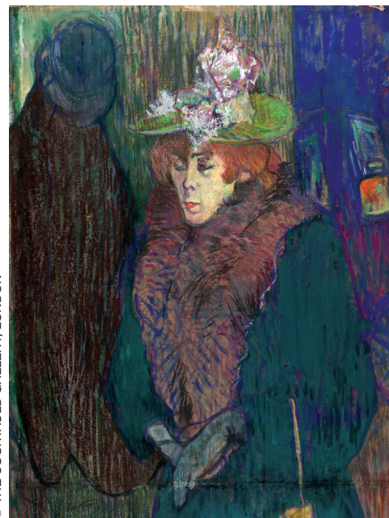
H. de Toulouse-Lautrec, JANE AVRIL À L'ENTRÉE DU MOULIN-ROUGE, vers 1892, huile et pastel sur carton.

JANE AVRIL DÉCOUVRE assez jeune le monde de la nuit et les lieux troubles de Paris dont Toulouse-Lautrec s'est fait le chantre. Si son allure fragile et éthérée en fait un personnage à part dans ce milieu interlope, sur scène elle se transforme en danseuse pleine d'énergie. Talentueuse, amoureuse de la danse, elle y trouve sa voie. Seulement, sa fragilité nerveuse lui fait supporter les terribles surnoms de "Jane la Folle" ou de "Mélinite". Connue pour son allure et sa personnalité exotique, égérie de Toulouse-Lautrec dont elle admire le talent, elle connaît une gloire certaine, assurée par la série d'affiches flamboyantes réalisées par le célèbre peintre. Jane Avril devint une figure emblématique dans le monde de Lautrec où danseurs, chanteurs de cabaret, musiciens et concubines s'entremêlent. L'exposition révèle les différents visages de Jane Avril et, à travers le Moulin-Rouge, célèbre une relation créative entre le modèle et le peintre qui capture l'effervescence et le spectacle de la vie bohème parisienne. Jane Avril, l'étoile du monde florissant du Montmartre de l'époque s'affiche à notre grand plaisir à la Courtauld Gallery.