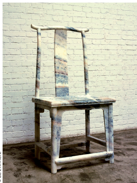
© DE L'ARTISTE Ai Weiwei, MARBLE CHAIR , 2008, marbre.

FILS DU CÉLÈBRE POÈTE et prisonnier politique Ai Qing, Weiwei, l'une des figures de la scène artistique indépendante chinoise, la plus attaquée par ses gouvernants et à la fois la plus cotée au monde, expose sa dernière œuvre, mêlant sculpture et vidéo, à la Lisson Gallery. Si cet homme fait tant parler de lui, c'est que son message dérange fortement les autorités chinoises. Artiste engagé, Weiwei s'est vu à plusieurs reprises menacé d'être assigné à résidence. En juin 2009, aux prises avec la censure détruisant toute tentative de commémorer le massacre de la place Tiananmen, il diffuse sur Internet un poème ironiquement intitulé Oubliions . Il en paiera le prix. En décembre 2010, alors que l'artiste doit se rendre en Corée du Sud, la police refuse sa sortie de Chine sous prétexte qu'il met "en danger la sécurité nationale" du pays. Cette année, sa première grande exposition, organisée dans son pays par le collectionneur belge Guy Ullens, se voit annulée. Et pour cause, il reste l'un des artistes les plus virulents envers le pouvoir chinois. Mais rassurons-nous, Londres accueille Ai Weiwei avec déférence, égard et liberté d'expression.