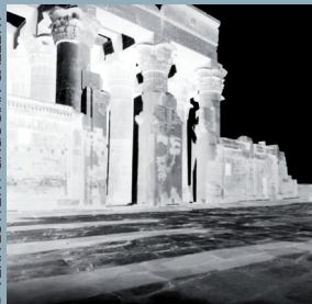
Vera Lutter, KOM OMBO TEMPLE, JANUARY 26, 2010 , tirage argentique unique.