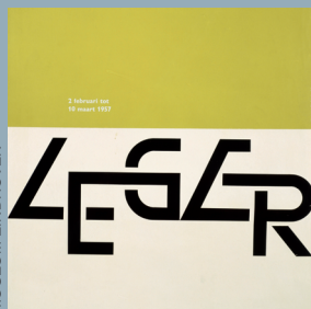
Wim Crouwel, AFFICHE POUR L'EXPOSITION LÉGER , 1957.

© W. CROUWEL / STEDELIJK VANABBE MUSEUM EINDHOVEN