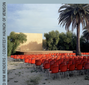
Wim Wenders, OPEN AIR SCREEN, PALERMO (détail), 2007, C print.