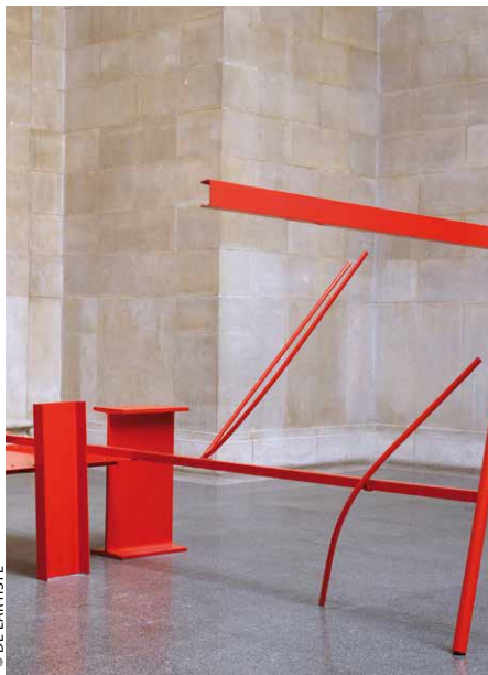
Anthony Caro, KEY66, sculpture en acier peint.

* Une magnifique bronze de plus de 6 mètres de haut dédié à la mémoire de l'ancien secrétaire général de l'ONU Dag Hammarskjöld.