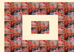
Gilbert & George, BUSES, 2009. Collection Mudam Luxembourg

Lisson Gallery – 52-54 Bell Street, Londres NW1 5DA www.lissongallery.com jusqu'au 29 janvier